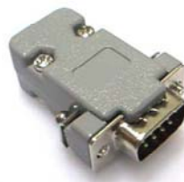
케이스 내부 내장